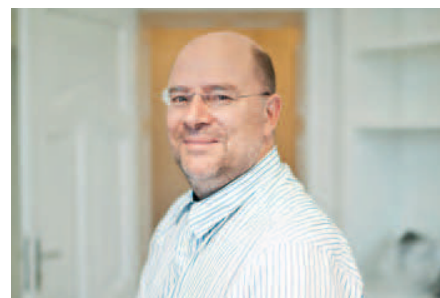
Dir. Andreas Rudigier: „Es gibt keinen Tag Verzögerung, auch die Kosten werden penibel eingehalten – was bei einem öffentlichen Bau durchaus erfreulich ist.“