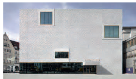
vorarlberg museum vom Kornmarkt her gesehen: „Für mich sind die klare Formensprache des Baus und die extrem stimmige Materialverwendung beeindruckend.“