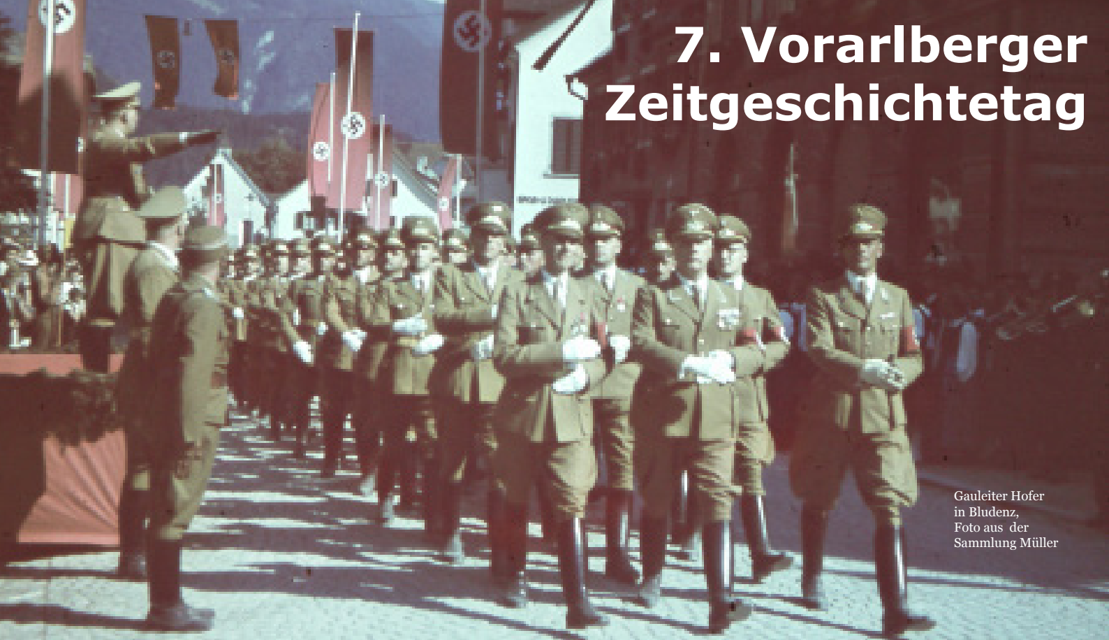
Gauleiter Hofer in Bludenz