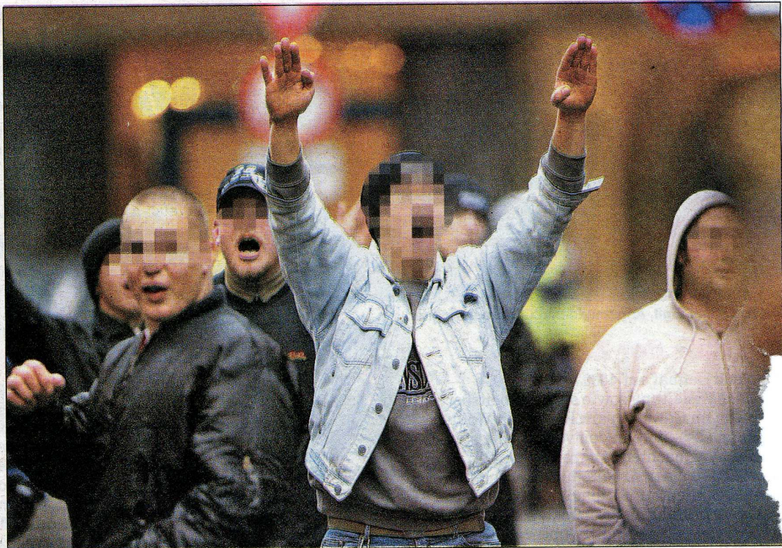
Rechtsextremismus ist leider auch in Vorarlberg ein Thema: Mitdiskutieren beim Round Table.