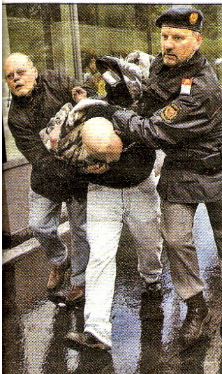
Die Polizei führt einen Skin, der eine Antifa-Demo stören wollte, ab.