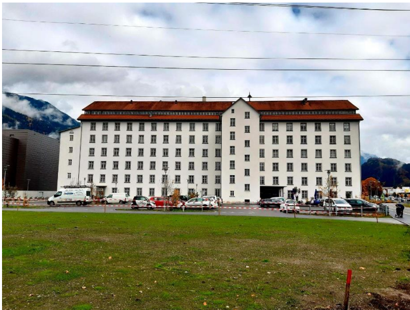
Lünenseefabrik Bürs

Auf DERLA sind exemplarisch auch Orte aufgenommen worden, die bislang über kein öffentlich sichtbares Erinnerungszeichen verfügen. Damit soll auf Leerstellen in der Erinnerungslandschaft aufmerksam gemacht werden. Ein solcher Ort ohne Zeichen ist etwa das Marienheim in der St. Peterstraße in Bludenz: Von diesem Kinderheim ließen die Nationalsozialist:innen Kinder in die „Heil- und Pflegeanstalt Valduna“ und an andere Orte deportieren. Oder die Lünenseefabrik in Bürs: Die in Bludenz registrierten Gefangenen – im Dezember 1940 rund 300 – waren überwiegend in zwei Lagern untergebracht, darunter eines auf dem Gelände der „Lünenseefabrik“ Bürs.